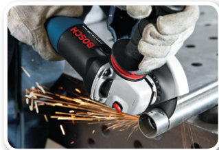
Bau- und Werkzeugtechnik