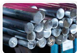
Stahl und Werkstoffe