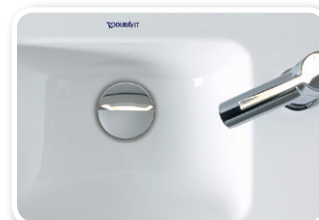
Heizung und Sanitär